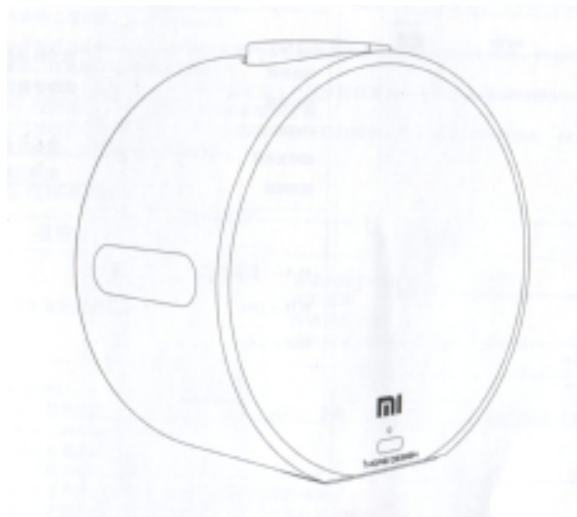
Тыльная сторона Mi Music Alarm Clock