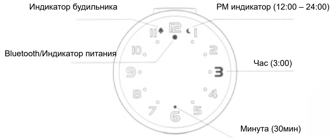
Передняя сторона Mi Music Alarm Clock